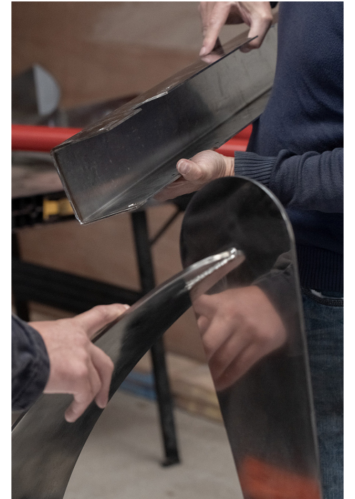
Reportage pour le sculpteur Patrick Hulaud, lors de l'assemblage de son œuvre intitulée « Vue sur mer », aux côtés d'Aurélien Dolo, soudeur nucléaire